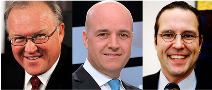
Göran Persson - Fredrik Reinfeldt - Anders Borg