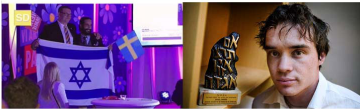
Sverigedemokraternas valvaka 2014